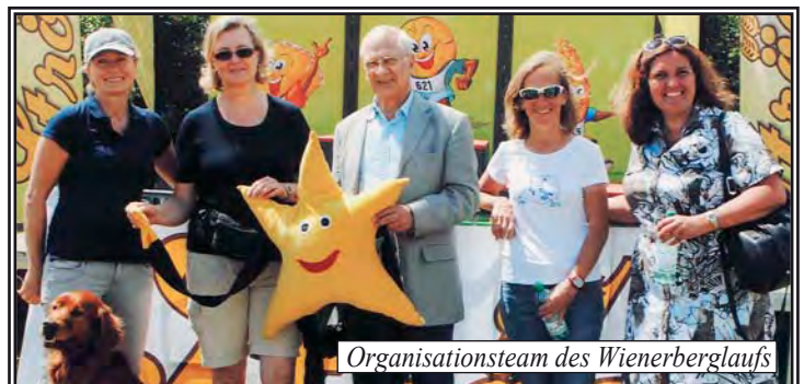
Organisationsteam des Wienerberglaufs