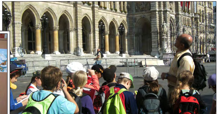
Wenn die Stärken jedes Einzelnen erkannt und genützt werden, ist vermehrt erlebnisorientierter Unterricht möglich.

wir haben keine bis vielfältige Vor- und außerschulische (Berufs-)Erfahrungen, uns „reicht“ die Zeit von 8 bis 13 (halbtägige) bzw. 15.30 Uhr (ganztägige Schulformen) in der Schule, um alles zu erledigen (Achtung: Ironie!), oder wir sitzen selbst zuhause und oft