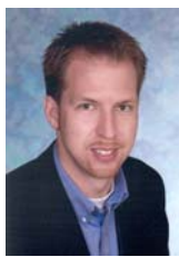
von Bernhard Thiel