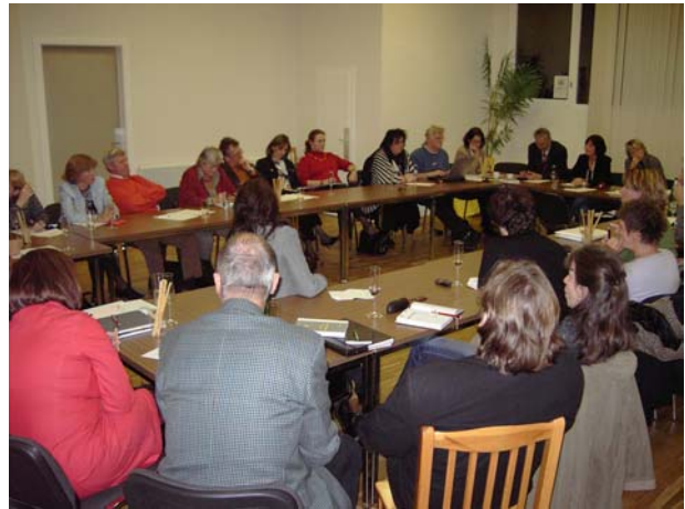
Die erste Leitungssitzung mit Blick auf den Stephansdom