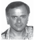
von Alfred Jirovec

Glänzende Augen, ein leises Knistern, der heimelige Duft der Kindheit und ein in Vorfreude schier zerspringendes Herz – wie tausende andere kleine LehrerInnen hat mich der alljährliche Vorweihnachtstaumel praktisch aus dem Nichts ergriffen.