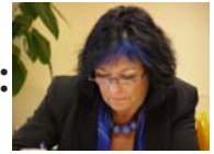
Vorsitzende des Zentralvereins der Wiener LehrerInnen