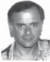
von Alfred Jirovec