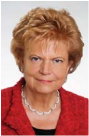
von Erni Graßberger