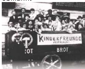
1911 Kinderfreunde Alsergrund auf Sonntagsausflug

1917 wird der "Reichsverein Kinderfreunde" gegründet. Max Winter wird der erste Reichsobmann.